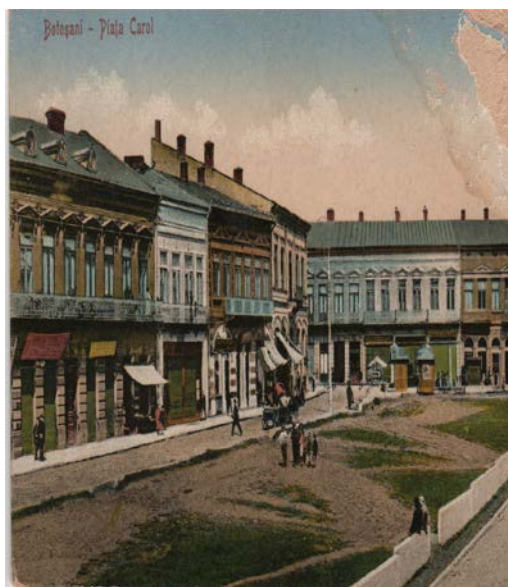
Poz. 1 - C.P.I. 1921. Piața „Carol” (după demolarea barăcilor)

Singurul spațiu disponibil pentru astfel de amplasament, a fost piața Carol (poz. 1) – azi Piața 1 decembrie 1918.