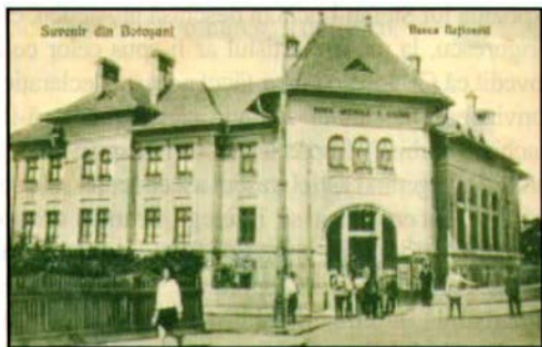
Fig. 8. Fostul sediu al B.N.R. (agenție, filială, sucursală) Botoșani.

Chiar dacă în documentele de arhivă există puține date concrete legate de evoluția lecturii publice, biblioteca a fost mereu prezentă în viața spirituală a comunității, fiind utilizate cele peste 3522 volume existente în urma inventarului din anul 1901 28 . Din cauza evenimentelor generate de primul război mondial, clădirea Liceului „Laurian” a ars împreună cu cea mai mare parte a fondului de carte. După război începe refacerea fondului de carte (recuperări și donații), încât în 1920 cei 1720 cititori aveau la dispoziție 970 volume. Din anul 1934 găsim în documente denumirea de Bibliotecă Comunală, ce a funcționat în localul din strada Armeană nr. 11. În această perioadă fondul de carte s-a mărit cu 2000 volume prin donația savantului Grigore Antipa. În anul 1943 Biblioteca Comunală își schimbă sediul în casele TĂLMACIU din Calea Națională nr. 275. După trecerea frontului în martie 1944, organele locale au reluat inițiativa refacerii fondului de carte, încât la 01.02.1945 Ziarul Clopotul consemnează: „Nu este o întâmplare că în acest oraș există cea mai mare bibliotecă din nordul Moldovei ...”. În luna mai 1948, conform unui proces-verbal de predare-primire, fondul includea 15.478 volume. Din 1951 „Biblioteca comunală” devine „Bibliotecă regională”, iar în 1952, conform noii împărțiri administrativ-teritoriale, se transformă în „Bibliotecă raională”. În anul 1968 este încadrată la categoria de „Bibliotecă municipală”, iar din 1974 și în prezent, „Bibliotecă județeană”.