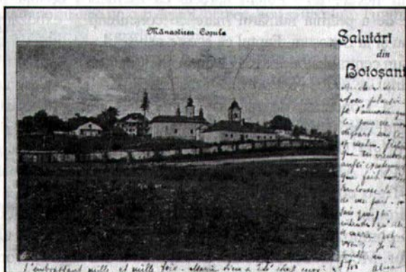
Fig. 5: C.P.I. circulată din Botoșani (28.04.1900) la Tg. Ocna (29.04.1900).