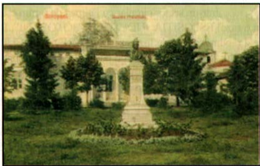
Foto1. C.P.I. circulată de la Botoșani la Tg. Neamț (04.04.1911) 1990 U.P.U. Editura Ad. Maier & Stern – București (în colecția autorului).