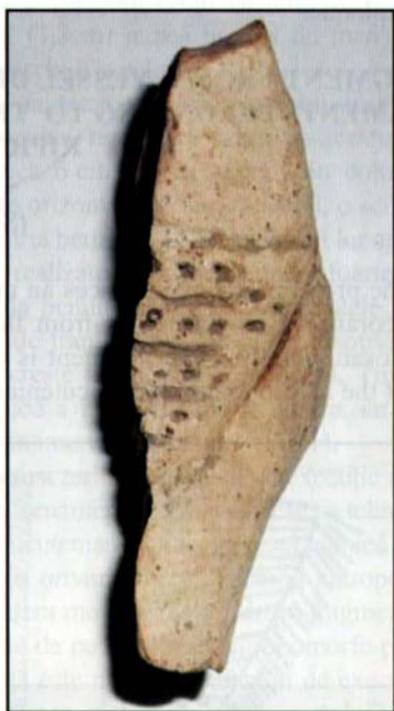
Fig. 2 - Statuete cucuteniene cu motivul „șorțului” de la Ripiceni-Holm