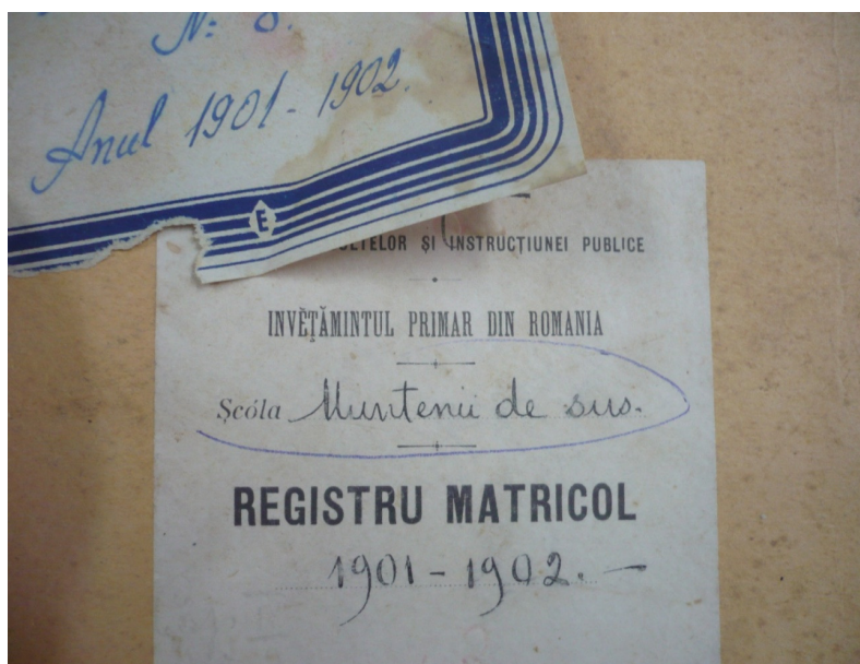
Registrul Matricol al “Școlii Primare Mixte” din Muntenii de Sus (1901-1902)