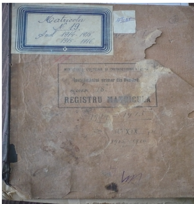
Registrul matricol nr.18 al “Școlii Primare Mixte” din Muntenii de Sus (1914-1915, 1915-1916)