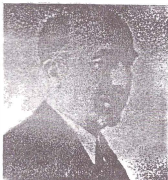
Anul I. Cernăuți, Marți, 22 Octombrie 1918 Nr. 1.