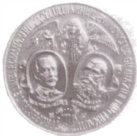
Fig.4 Profesorii de limba română ai învățcelului Mihail Eminovici la gimnaziul din Cernăuți