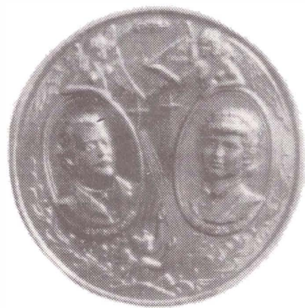
Fig. 3 Părinții poetului Gheorghe și Raluca Eminovici