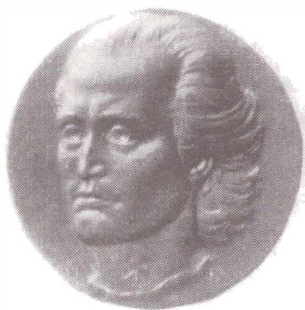
Fig. 2 Mihai Eminescu (1850-1889)