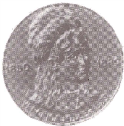
Fig. 1 Veronica Micle (1850-1889)