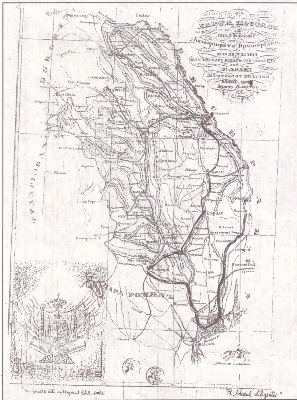
Fig. 3 Harta Moldovei, Iași, 1847 (litografie: Ianko). Drumul parcurs de Gh. Asachi la revenirea în țară.