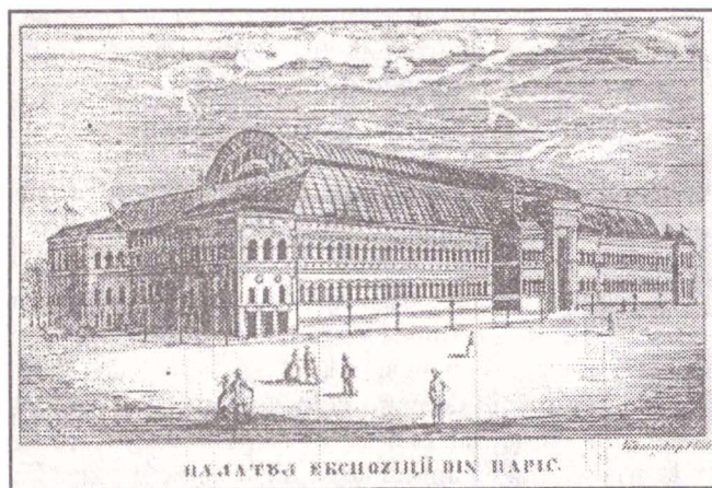
Fig. 1 Palatul Expoziției din Paris (Calendar, 1856)

Steaoa Dunării , în ediția sa de sâmbătă 12 noiembrie, anunță sosirea la Iași a lui Asachi, comentând malițios: "cea întâiu impresie ce au primit după întoarcerea sa în dulcea patrie au fost de fi atacat de bandiți, între Tecuci și Bârlad. Scăparea sa au datorit-o numai curagiului postilionilor și răpegiunii picioarelor cailor de poștă"