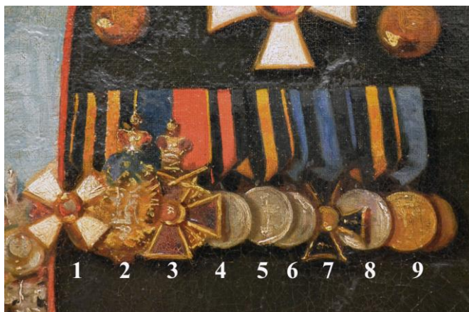
Fig. 7 – Horovici, Paul Demetrius von Kotzebue , general-guvernator al Noii Rusii și Basarabiei (1871). Detaliu: 1. Ordinul Sf. Gheorghe clasa a IV-a; 2. Ordinul Vulturul Alb; 3. Ordinul Sf. Ana clasa a II-a cu coroană imperială și spade; 4-6. Cele trei medalii militare pentru Războiul Crimeii; 7. Insigna Poloneză a Onoarei; 8. Medalia Pentru slujire și vitejie; 9. Medalia Pentru truda de eliberare a țăranilor