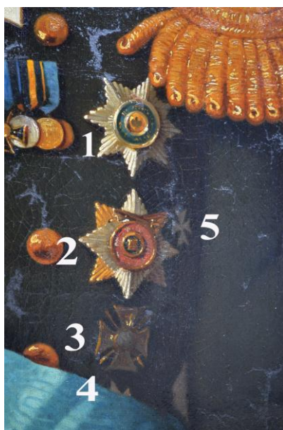
Fig. 8 – Horovici, Paul Demetrius von Kotzebue , general-guvernator al Noii Rusii și Basarabiei (1871). Detaliu: 1. Steaua Ordinului Sf. Andrei; 2. Steaua Ordinului Sf. Vladimir cu spade "pe ordin"; 3. Crucea Ordinului Sf. Vladimir clasa a IV-a; 4. Steaua Ordinului Sf. Stanislav (?); 5. Insigna specială din argint din 17 aprilie 1863 pentru aplicarea eliberării țăranilor din șerbie (?)