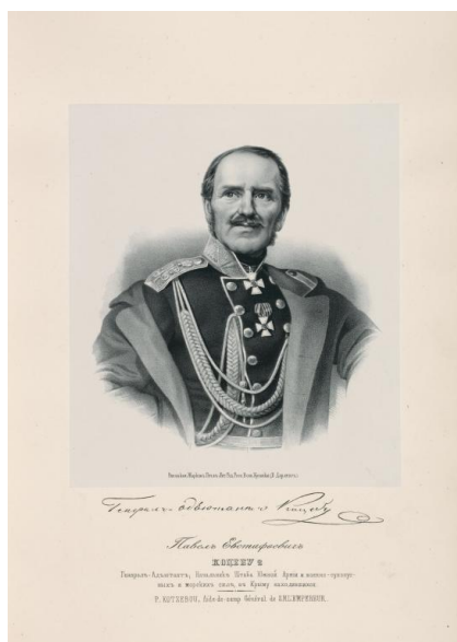
Fig. 2 – Generalul-aghiotant Paul Demetrius von Kotzebue. Litografie (1858-1861). După: Портреты лиц, отличившихся заслугами и командовавших действующими частями в войне 1853-1856 годов , 3 vol., Sankt-Peterburg, 1858-1861