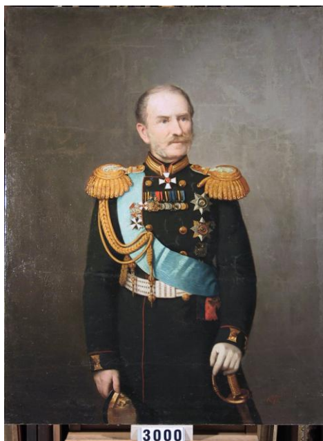
Fig. 1 – Horovici, Paul Demetrius von Kotzebue , general-guvernator al Noii Rusii și Basarabiei (1871)