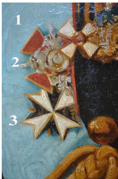
Fig. 6 – Horovici, Paul Demetrius von Kotzebue , general-guvernator al Noii Rusii și Basarabiei (1871). Detaliu: 1. Eșarfa Ordinului Sf. Andrei; 2. Insigna Ordinului Sf. Aleksandr Nevskii; 3. Insigna Corpului Pajilor