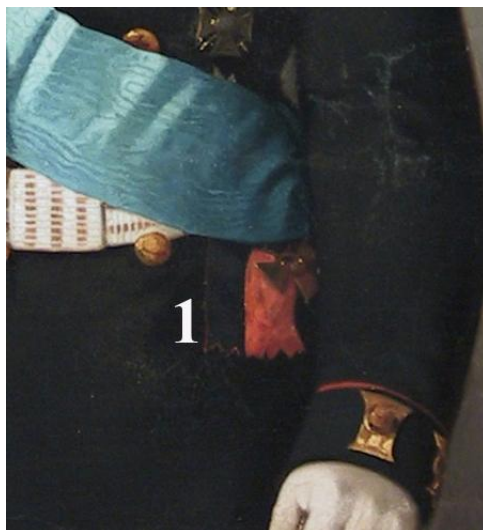
Fig. 5 – Horovici, Paul Demetrius von Kotzebue , general-guvernator al Noii Rusii și Basarabiei (1871). Detaliu: 1. Eșarfa Ordinului Sf. Vladimir cu insigna aferentă