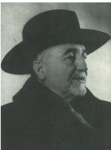
Fig. 6 – Sextil Pușcariu