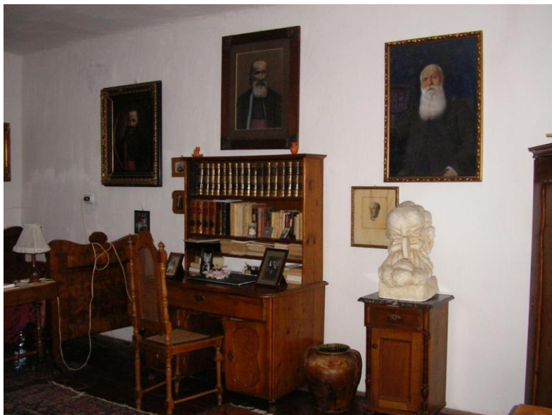
Fig. 4 – Interior al casei cărturarilor Pușcariu