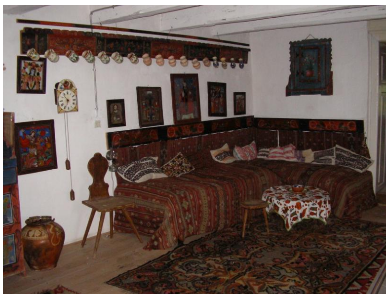
Fig. 3 – Interiorul casei din Sohodol – Bran a cărturarilor Pușcariu