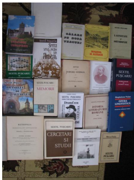
Fig. 2 – Din cărțile lui Sextil Pușcariu