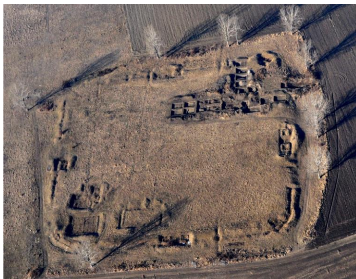
Fig. 1 – Vedere aeriană a castrului roman de la Cumidava – Râșnov

Keywords : Roman fort Râșnov, Claudius Ptolemaeus, high terrace Bârsa.