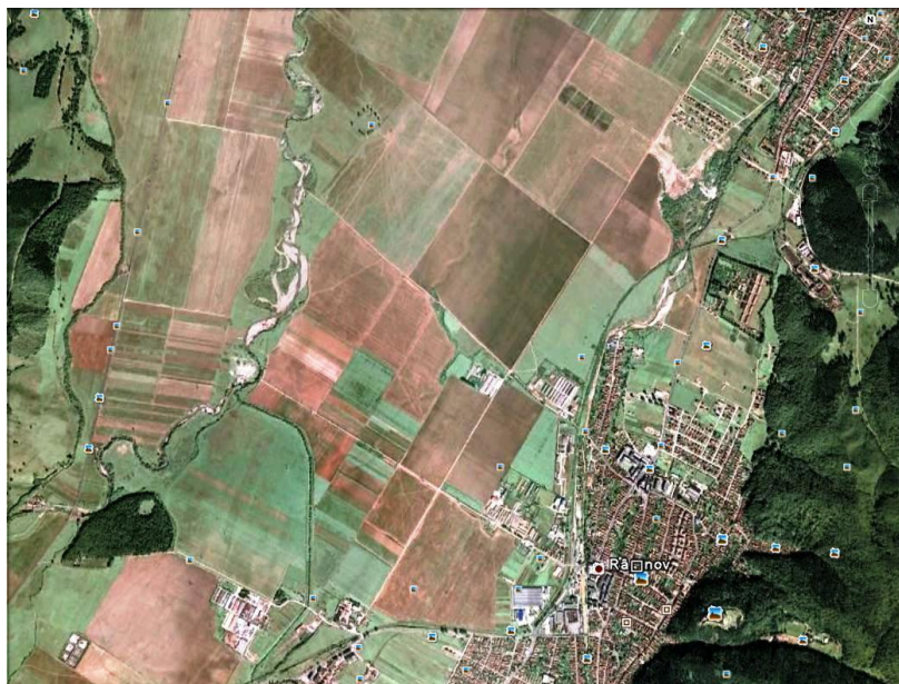
Fig. 3 – Fotografie aeriană pe Google Earth

În perioada scursă până la noi, de aproape 240 de ani, s-au făcut multe lucrări de sistematizare și amenajare a terenului din jurul castrului, mai ales pentru agricultură.