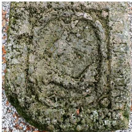
Fig. 6 – Stema Nemes de Hídvég