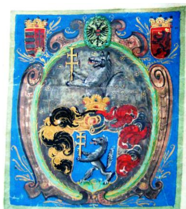
Fig. 16 – Stema Szentkereszty de pe diploma de înnobilare