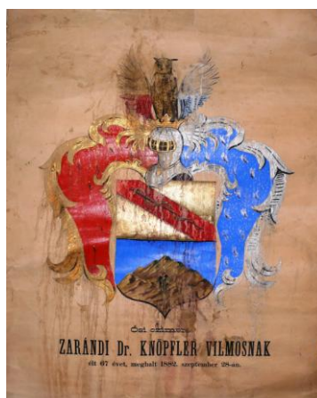
Fig. 28 – Stema lui Vilmos Knöpfler din 1882