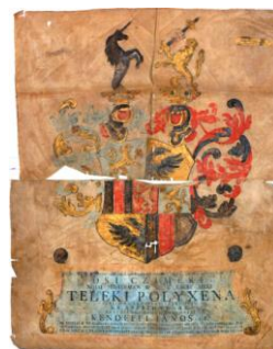
Fig. 19 – Blazonul doamnei Polyxéna Teleki din 1797