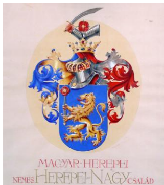
Fig. 11 – Stema familiei Herepei