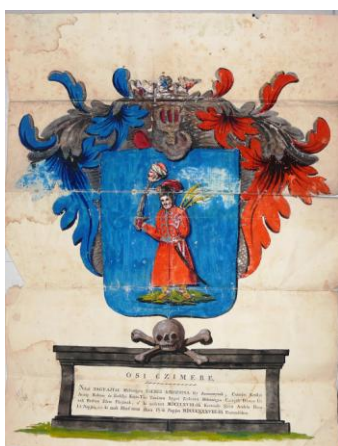
Fig. 27 – Stema lui Krisztina Cserei din 1838