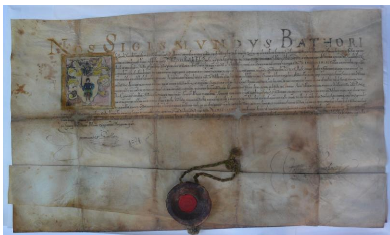
Fig. 17 – Diploma de înnobilare a lui Péter Márk de Egerpatak