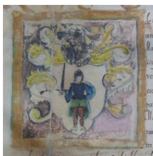
Fig. 18 – Stema familiei Márk de Egerpatak de pe diploma de înnobilare