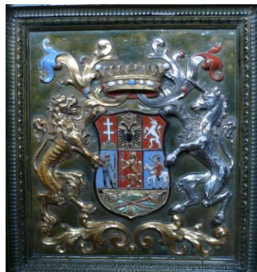
Fig. 8 – Stema Mikes de pe o cahlă uriașă