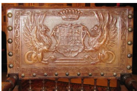
Fig. 9 – Stema Mikes de pe un spătar