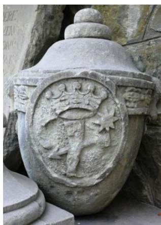
Fig. 3 – Stema Béldi de Uzon