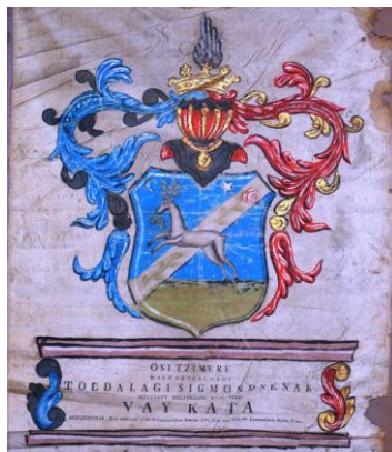
Fig. 20 – Stema lui Tamás Wass din 1831 Fig. 21 – Stema lui Kata Vay din 1831