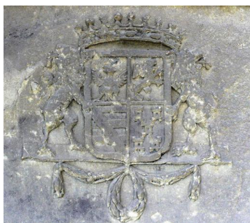
Fig. 4 – Stema Zenone di Castelceriolo