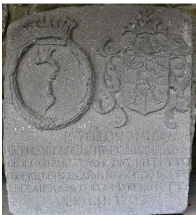
Fig. 5 – Stema de alianță Bethlen-Gyulay