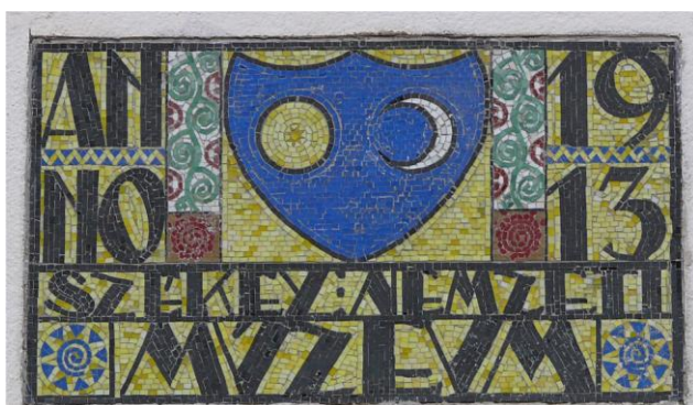
Fig. 2 – Stema Muzeului Național Secuiesc