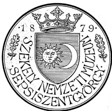
Fig. 13 – Sigiliul heraldic al Muzeului Național Secuiesc