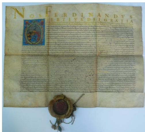
Fig. 15 – Diploma de înnobilare a familiei Szentkereszt