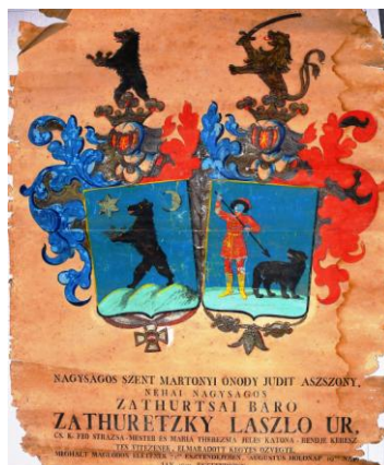
Fig. 26 – Stema doamnei Zathuretzky din 1828