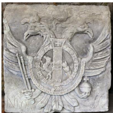
Fig. 7 – Stema Imperiului Habsburgic