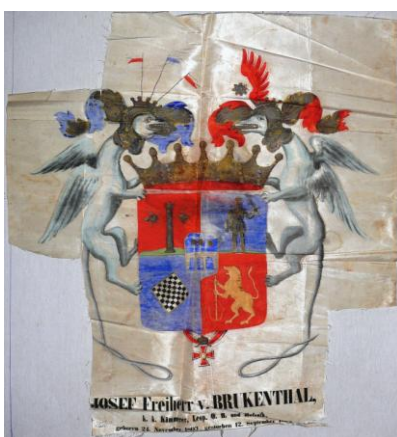
Fig. 22 – Stema lui Josef von Brukenthal din 1867