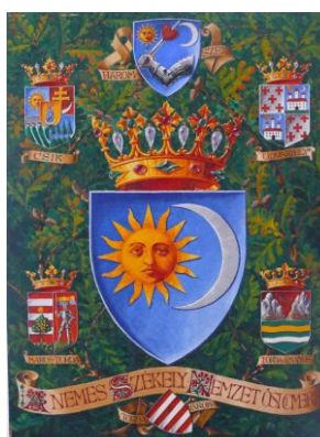
Fig. 10 – Stema Nobilei Națiuni a Secuilor