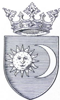
Fig. 12 – Stema națiunii secuiești