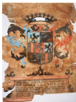
Fig. 24 – Stema lui Klára Teleki din 1770