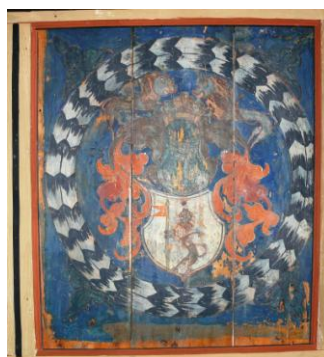
Fig. 14 – Stema Bibó de Barátos