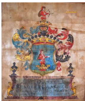
Fig. 23 – Stema lui Rákhel Kendeffi din 1898