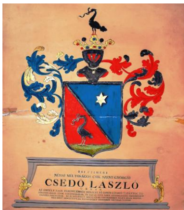
Fig. 25 – Stema lui László Csedő din 1826