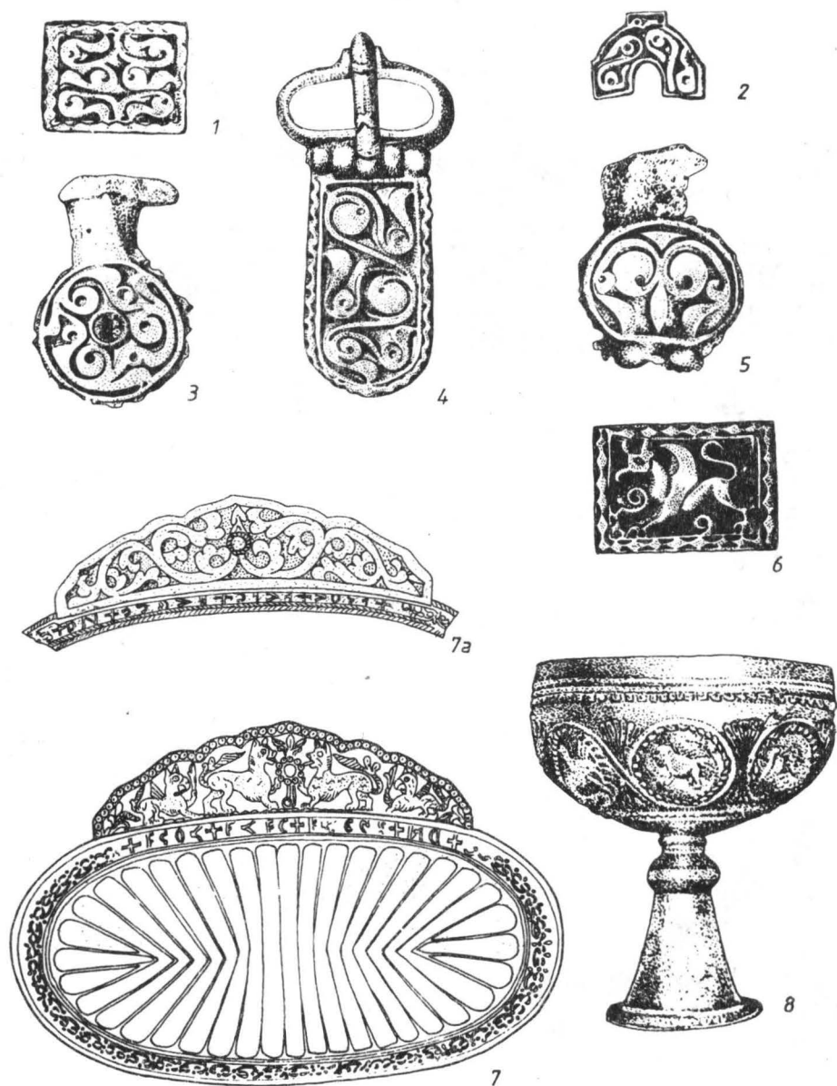
Fig. 1. — Tezaurul de la Vrap — Albania (1—6,8); Tezaurul de la Sinnicolaul Mare (7—7 a).